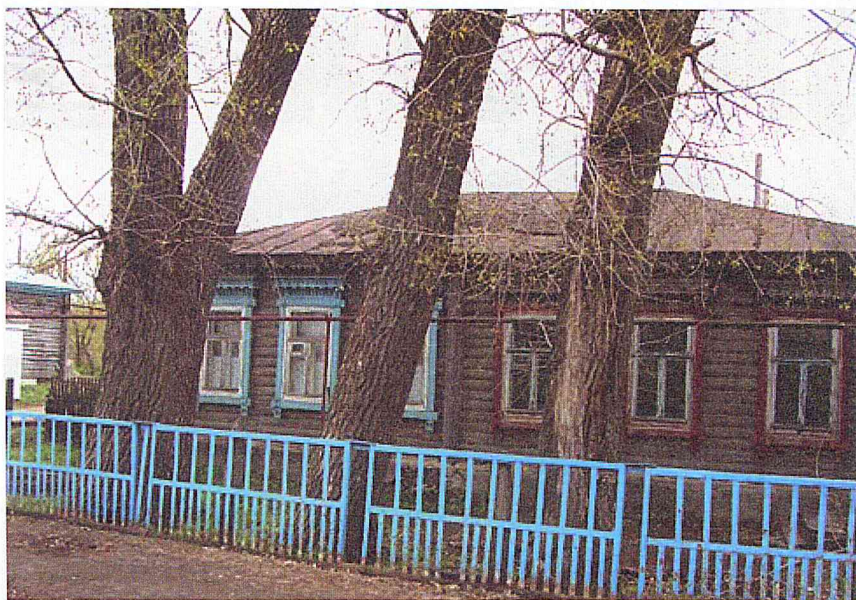
Дом, построенный в 1903 году для земских врачей

Вопрос, скорее всего, риторический, поскольку каждый наш сельчанин на своем опыте может убедиться, что из общественной памяти выпадают весьма значительные вехи собственной истории. В нашем селе, сколько я ни расспрашивал, никто не мог назвать село Рождественская Идолга.