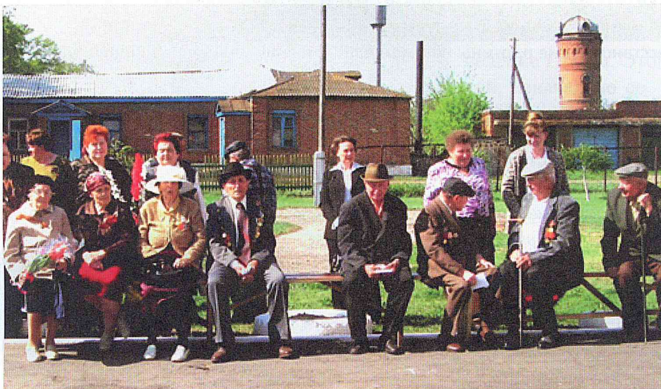
День Победы 2010 год