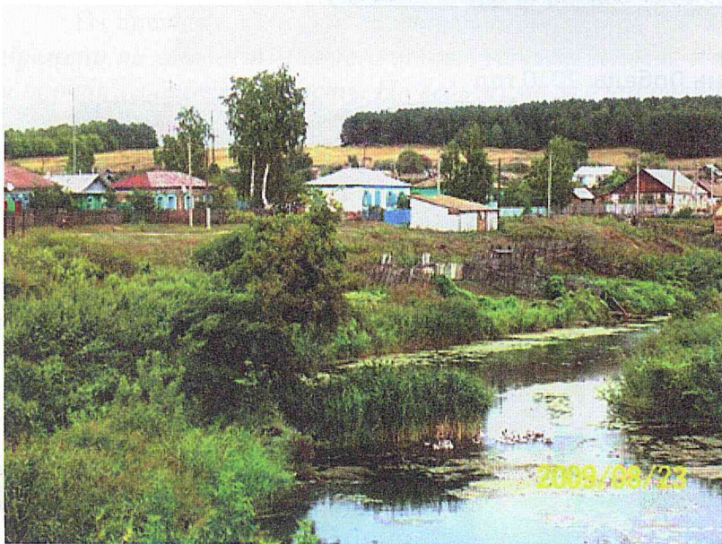
Вид на Дурасовку, Песчанку и речку Идолгу с «нового» моста.

Всё было разломано и растащено с каким-то отчаянным остервенением. А может, не стоило ломать? Ну, постояли бы некоторое время эти объекты пустыми, а в будущем обязательно нашёлся бы рачительный хозяин, который обратил бы всё это богатство на пользу селу. Ведь жизнь на этом не кончается.