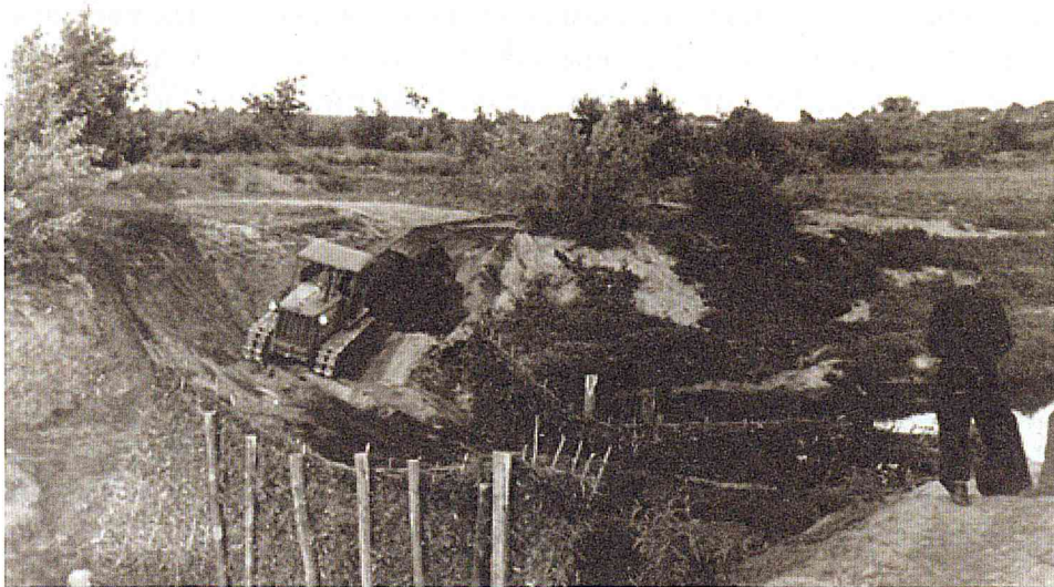
Восстановление плотины на Идолге. 50-е годы

Сейчас уже никто не может сказать, где стояла церковь во имя Рождества Христова и когда она перестала существовать. В памяти ещё хранится, что в 1905 году была построена деревянная церковь с престолом во имя Михаила Архангела (по другим менее достоверным сведениям она уже в 1903 году сгорела). Место, где церковь когда-то стояла, может показать каждый сельчанин, однако престольным праздником в нашем селе всегда считалось