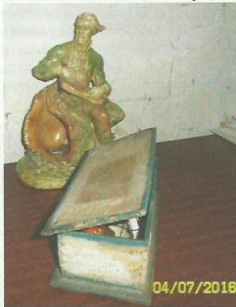
Та самая шкатулка