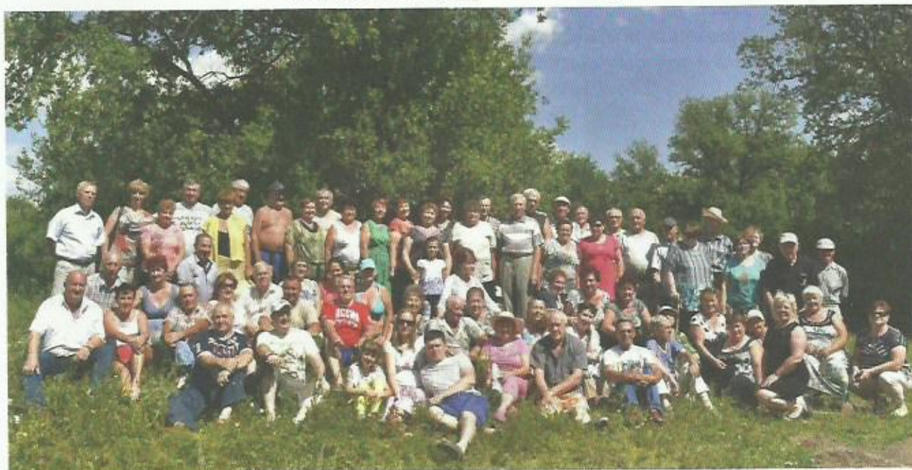
Юбилейное Вече 2015 года

Ежегодное издание неформальной, общественно-приятельской организации «Землячество Дурасовка-Озерное»