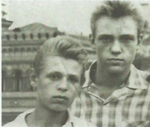
Нам уже 15 лет

Обратный путь по большой дуге между лесом и полем занимал всё время до обеда. Нужно было проверить - хороши ли арбузные всходы и посчитать дни до августа, когда можно будет ползком забираться на поле и катать арбузы под горку, самую дальнюю от сторожевого шалаша.