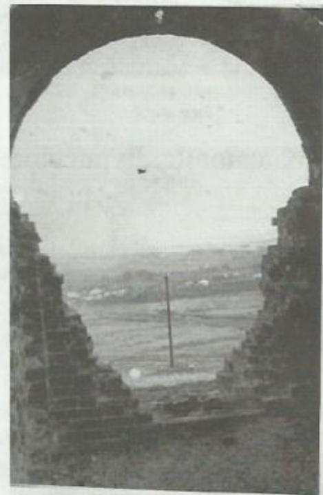
Вид на Сосновку из пролома в церковной стене. 1960 год.

Несколько раз в этом году случались настоящие праздники – приезд кинопередвижки. Так как электричества в селе не было, рядом с клубом устанавливался бензиновый движок, который нещадно тарахтел и глос несколько раз за