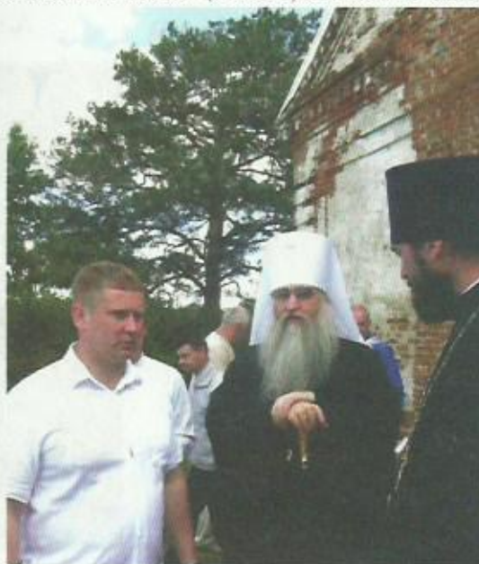
Власть светская и власть духовная