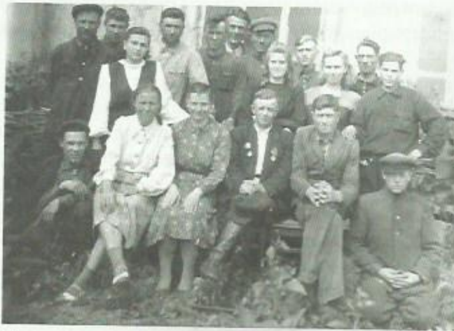
Отец (в центре) с сотрудниками Сосновской МТС. 1953 год.