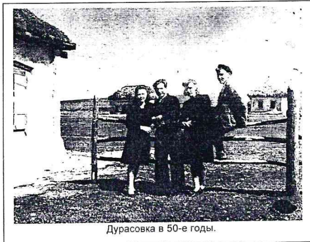
Дурасовка в 50-е годы.

Особо мне запомнились слеты, которые проводились в конце мая по окончании учебного года в самой Дурасовке. В прекрасную, фактически летнюю погоду, в кузове грузовой машины, с пионерскими знаменами и горнами мы с песнями спешили на встречу с учениками из других сел и с удовольствием выступали на концертах. А соседи были из довольно-таки далеких сел, начиная с Вяжли и до Малой Осиновки. И только Елизаветино относилось уже тогда к Аткарскому району.