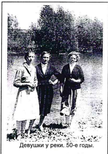
Девушки у реки. 50-е годы.

Природа облагодетельствовала наше село речкой Идолгой. Невелика речушка, но без неё трудно представить жизнь односельчан. Мало того, что она поила нас и наши огороды, у меня осталось ощущение, что она нас и воспитывала. Ведь львиную долю времени в детстве мы проводили на реке. И не только летом. Зимой расчищали каток и