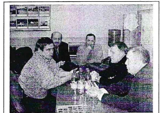
Заседает оргкомитет Совета Землячества .

Счастье – это когда дети сыты, обуты, одеты и их нет дома.