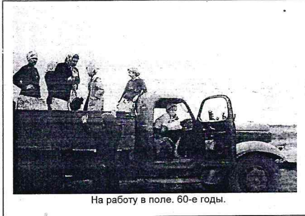
На работу в поле. 60-е годы.

Но как райцентр Дурасовка была всегда желаемой для поездок. Там я впервые в жизни увидел железную дорогу. И хотя та ветка всегда была неживленной, нам посчастливилось увидеть настоящий грузовой поезд с чудом-паровозом, который, правда не остановился, а прошел дальше, в сторону Баланды. В Дурасовке мы впервые попробовали ситро, мороженое, увидели двухэтажный дом. Это была школа. Находясь на улице и не заходя в здание, мы долго не могли понять, как же дети попадают на второй этаж?