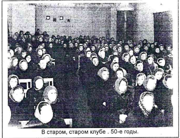
В старом, старом клубе. 50-е годы.

Хорошо помню, как пели в дороге известную песню М.Иорданского «У дороги чибис». Особым