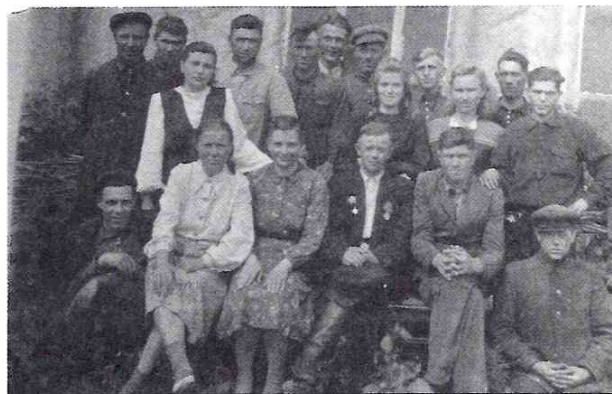
С.Сосновка. Отец с сотрудниками и механизаторами МТС