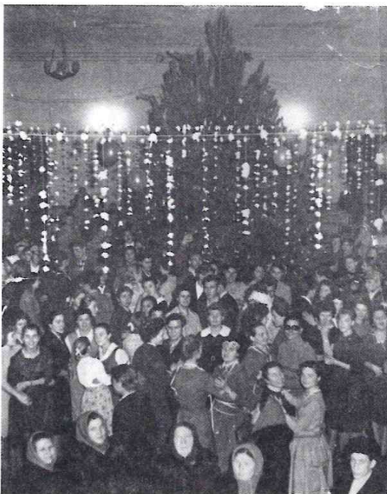
Новогодний вечер 1962 – 63 г.г.