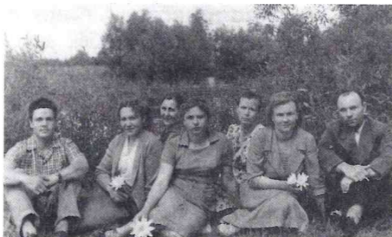
Сотрудники дома культуры. 60-е годы.

Опомнившись, быстро убрали битые игрушки, замели мусор и включили музыку. Кассир стала продавать билеты, танцующие заполнили зал, а о пожаре так никто и не узнал.