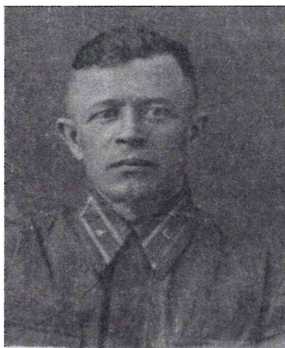
Отец в 1929 году во времена конфликта на КВЖД

Меня призвали 6-го июля 1941 года. Воевал я как и все в начале войны плохо. Липовые офицеры, аховые солдаты. Кадровая армия как будто куда то исчезла. Одни растерянные резервисты. В октябре 41-го был контужен. Немецкий танк наехал на ход сообщения, где я пытался укрыться. Мои товарищи сбоку сумели