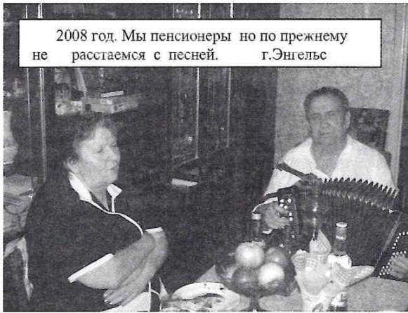
2008 год. Мы пенсионеры но по прежнему не расстанемся с песней. г.Энгельс