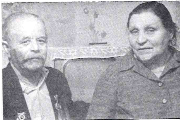
Отец и мама дома в с.Дурасовке

Это была добрая, спокойная женщина. Никого никогда не обсуждала и не осуждала. Её уважали односельчане, считались с её ненавязчивым мнением, а соседки часто собирались летними вечерами во дворе чтобы «посудачить».