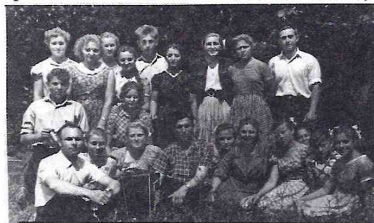
Танцевальный ансамбль Дурасовского ДК. После смотра. 1962 год