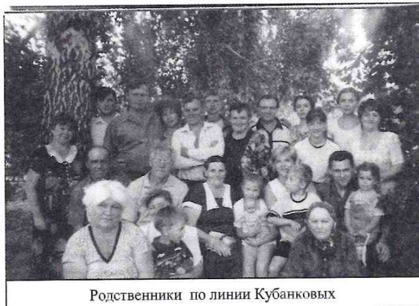
Родственники по линии Кубанковых