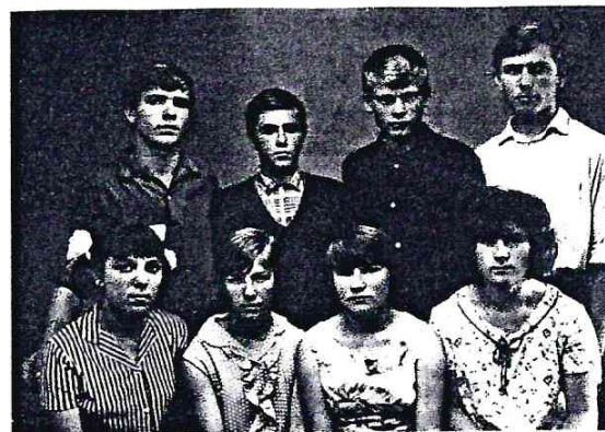
Конец шестидесятых. Взрослеющие одноклассники