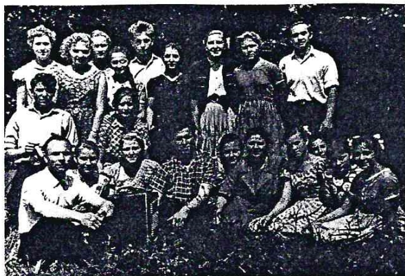
Танцевальная группа села Дурасовки. 1962 год