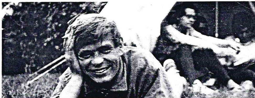
Редакторский привет с берегов Медведицы из 70-х годов.

Ко всему, чем бы я ни занимался, я всегда относился с долей иронии, даже к делам далеко не шуточным. Быть всегда и во всем серьезным человеком - удел людей безусловно умных, но слегка обделенных красками жизни. Но вот анализируя дела «земляческие» накануне пятого юбилейного года нашей неформальной организации, я слегка поскучнел и призадумался.